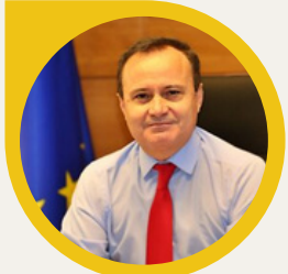
Ángel Viveros Alcalde de Coslada